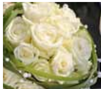
SERVIZIO DI FLORAL DESIGNER