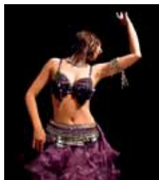
Un ringraziamento alla SCUOLA CAAP per trucco e acconciature modelle

Atelier Alexander è un atelier di produzione e vendita di abiti da sposa e cerimonia con esperienza consolidata, ma giovane di stile e gusto. Le collezioni esprimono il concetto di una donna raffinata, esigente e piena di vita. Ogni abito da sposa viene realizzato esclusivamente su misura con materiali di prima scelta, ricami e pizzi delicati, tutto creato a mano.