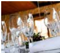
SERVIZIO CATERING DI ALTA QUALITÀ