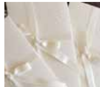
SERVIZIO DI GRAFICA